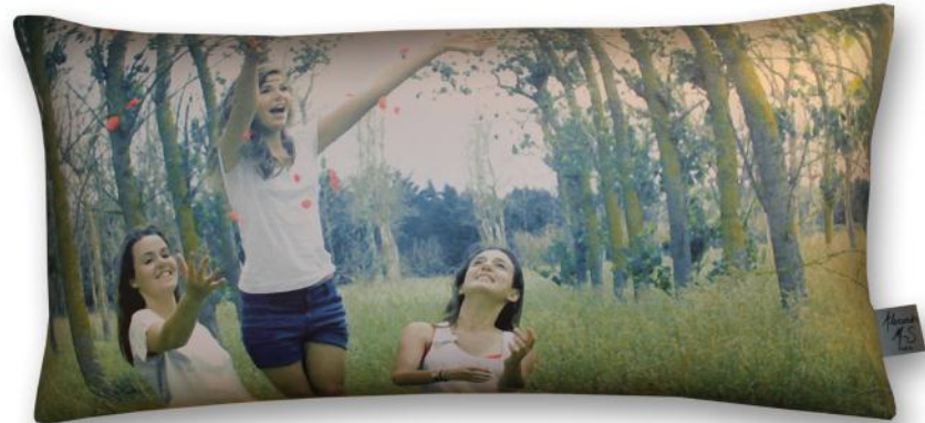
3060 Jeunes filles en fleurs *