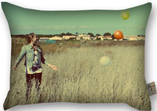
4040 L'Envol *