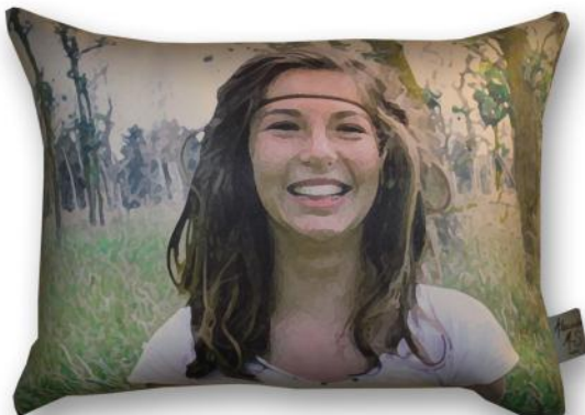
4040 Calliope *