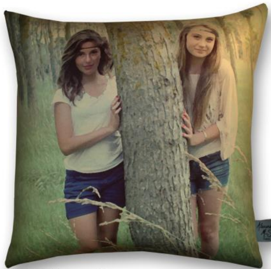
4040 Muses *

* Modèles créés à partir d'une oeuvre originale de la photographe Joana Evano. Items created from an original work of the photographer Joana Evano.