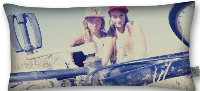
3060 Adolescence *