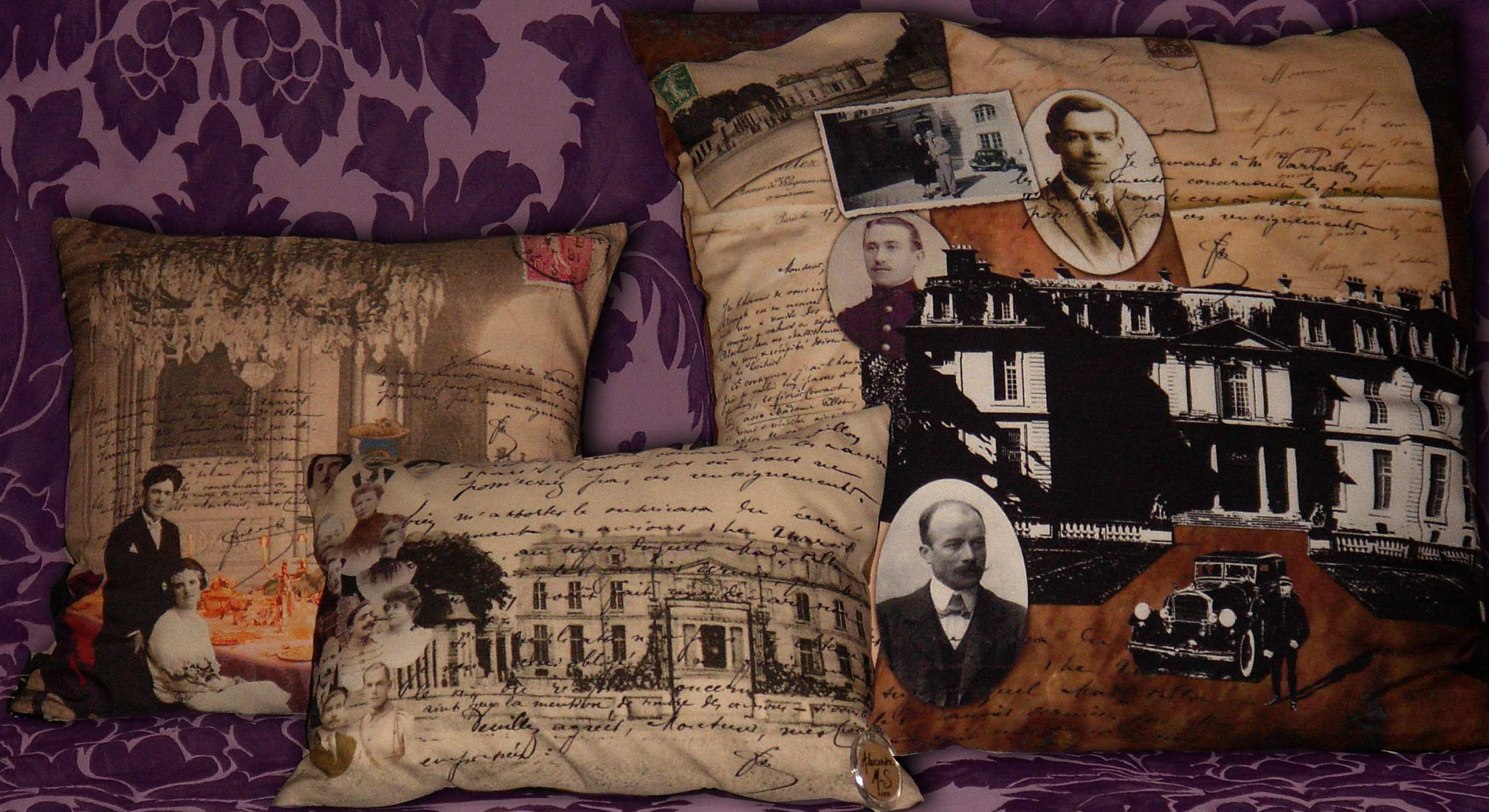
Coussins : "Diner aux chandelles" 40 x 40 cm - "Château familial" 30 x 40 cm - "Maison de famille" 60 x 60 cm