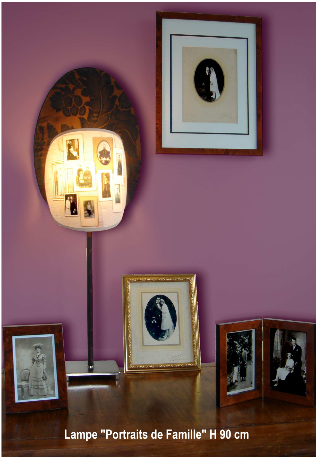
Lampe "Portraits de Famille" H 90 cm