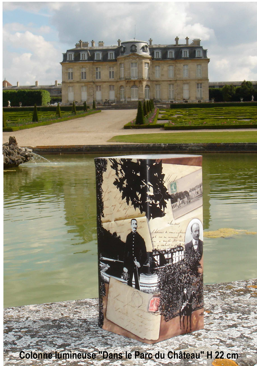
Colonne lumineuse "Dans le Parc du Château" H 22 cm