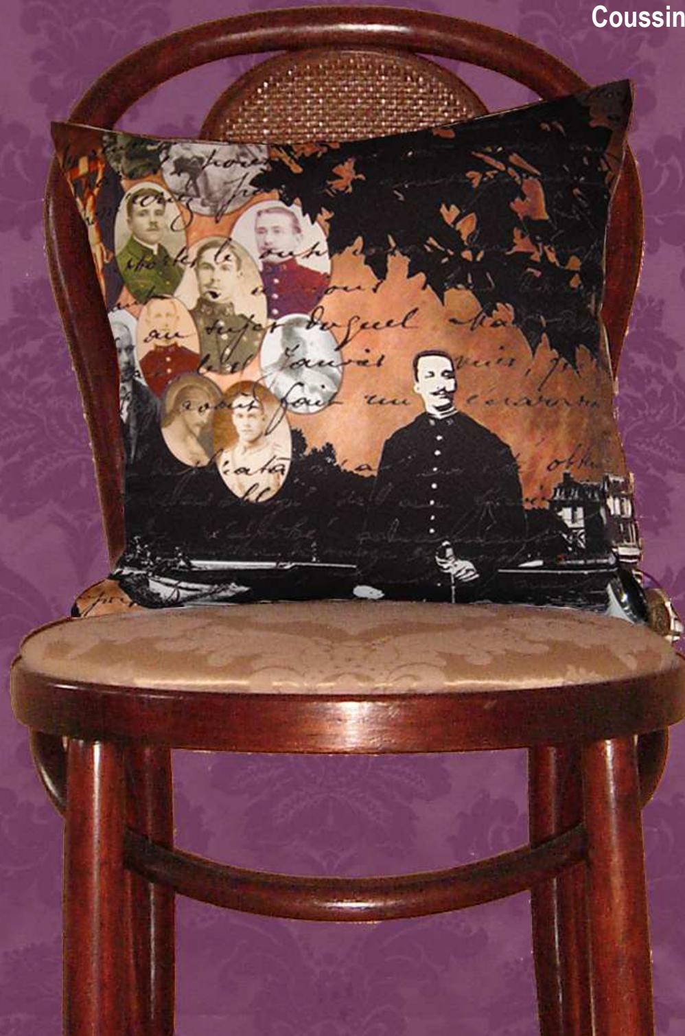
Coussin "A la Gloire de Dieu" 40 x 40 cm