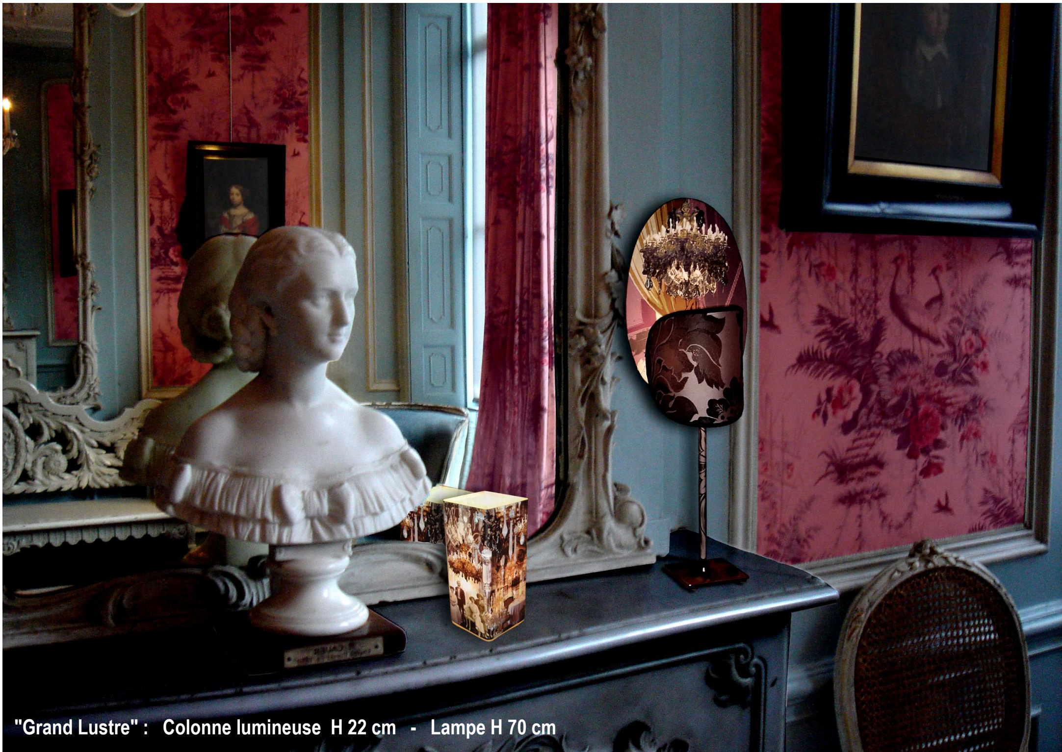
"Grand Lustre" : Colonne lumineuse H 22 cm - Lampe H 70 cm