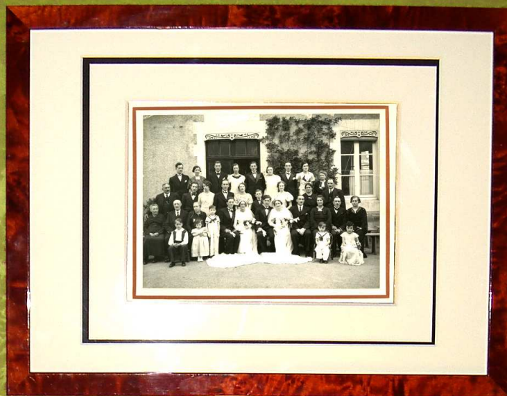
Colonne lumineuse "Généalogie" H 22 cm