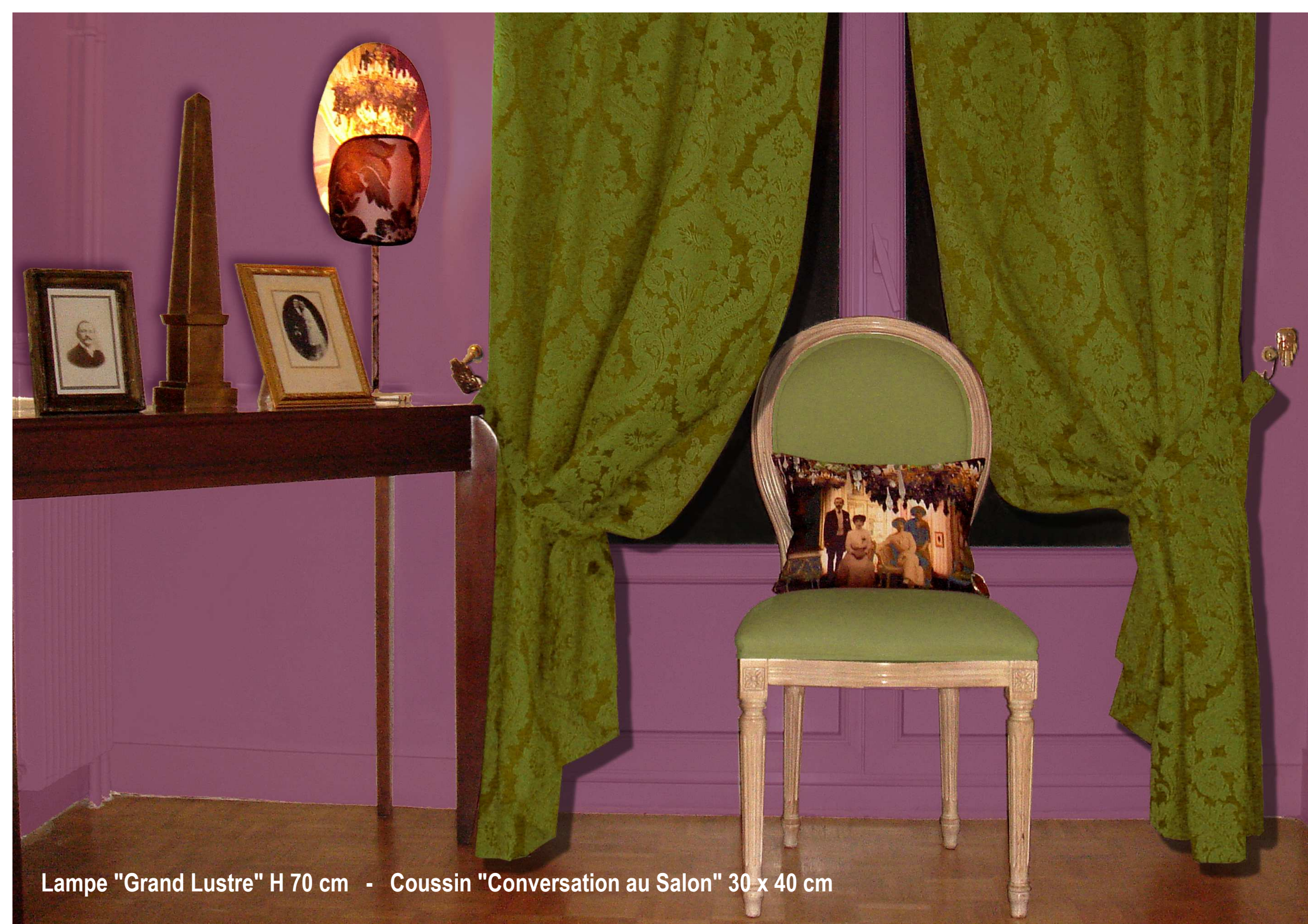
Lampe "Grand Lustre" H 70 cm - Coussin "Conversation au Salon" 30 x 40 cm