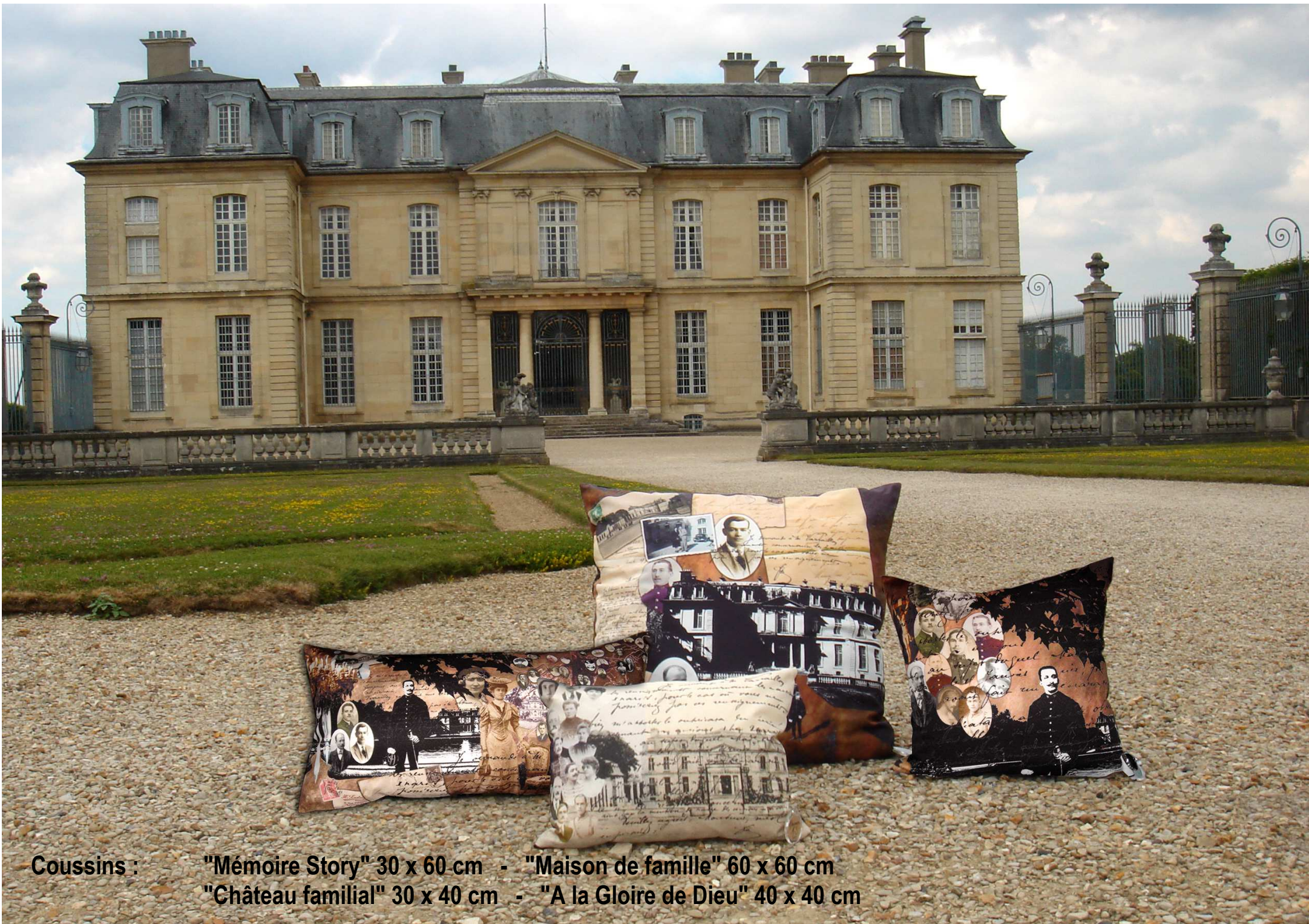
Coussins : "Mémoire Story" 30 x 60 cm - "Maison de famille" 60 x 60 cm "Château familial" 30 x 40 cm - "A la Gloire de Dieu" 40 x 40 cm