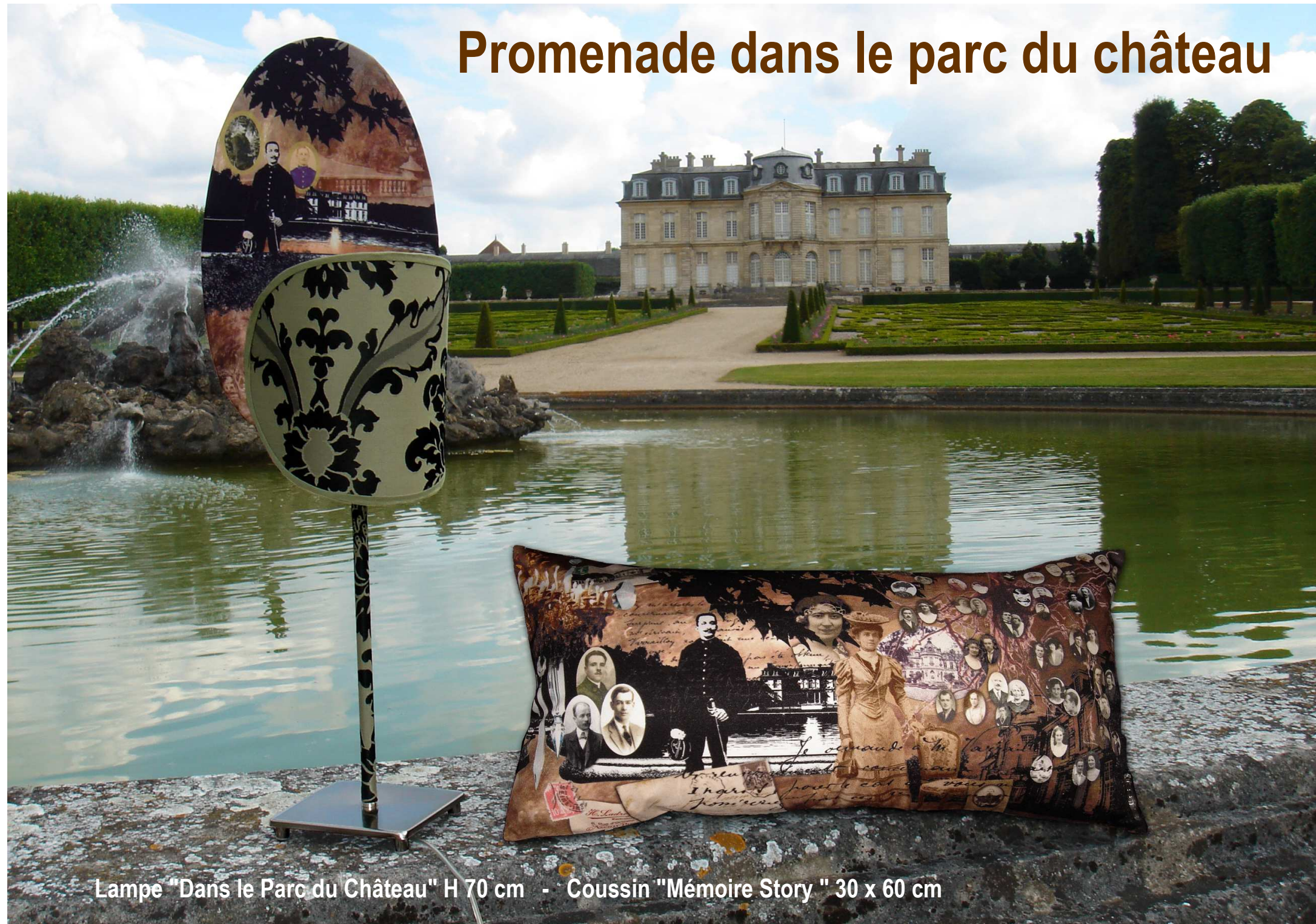
Lampe "Dans le Parc du Château" H 70 cm - Coussin "Mémoire Story " 30 x 60 cm