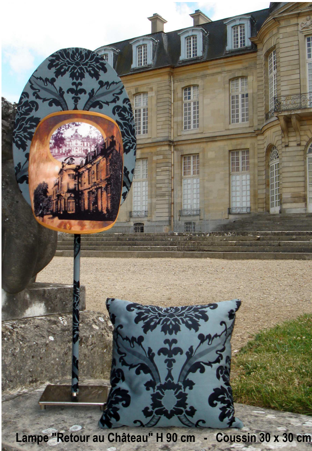
Lampe "Retour au Château" H 90 cm - Coussin 30 x 30 cm