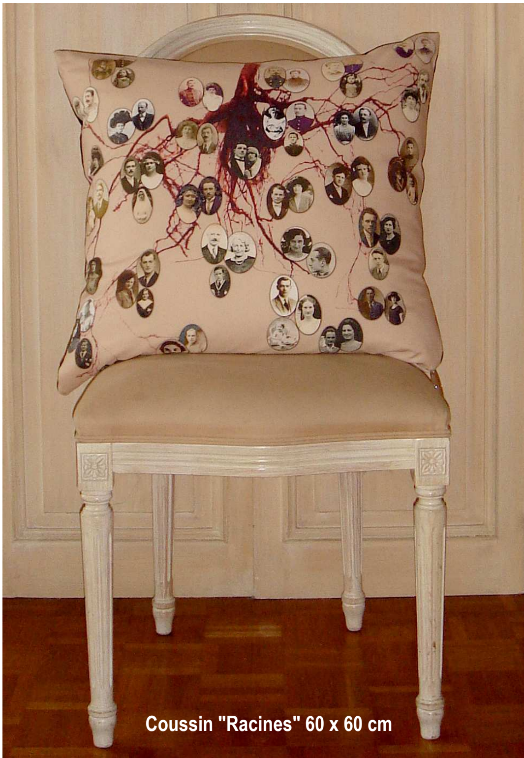
Coussin "Racines" 60 x 60 cm