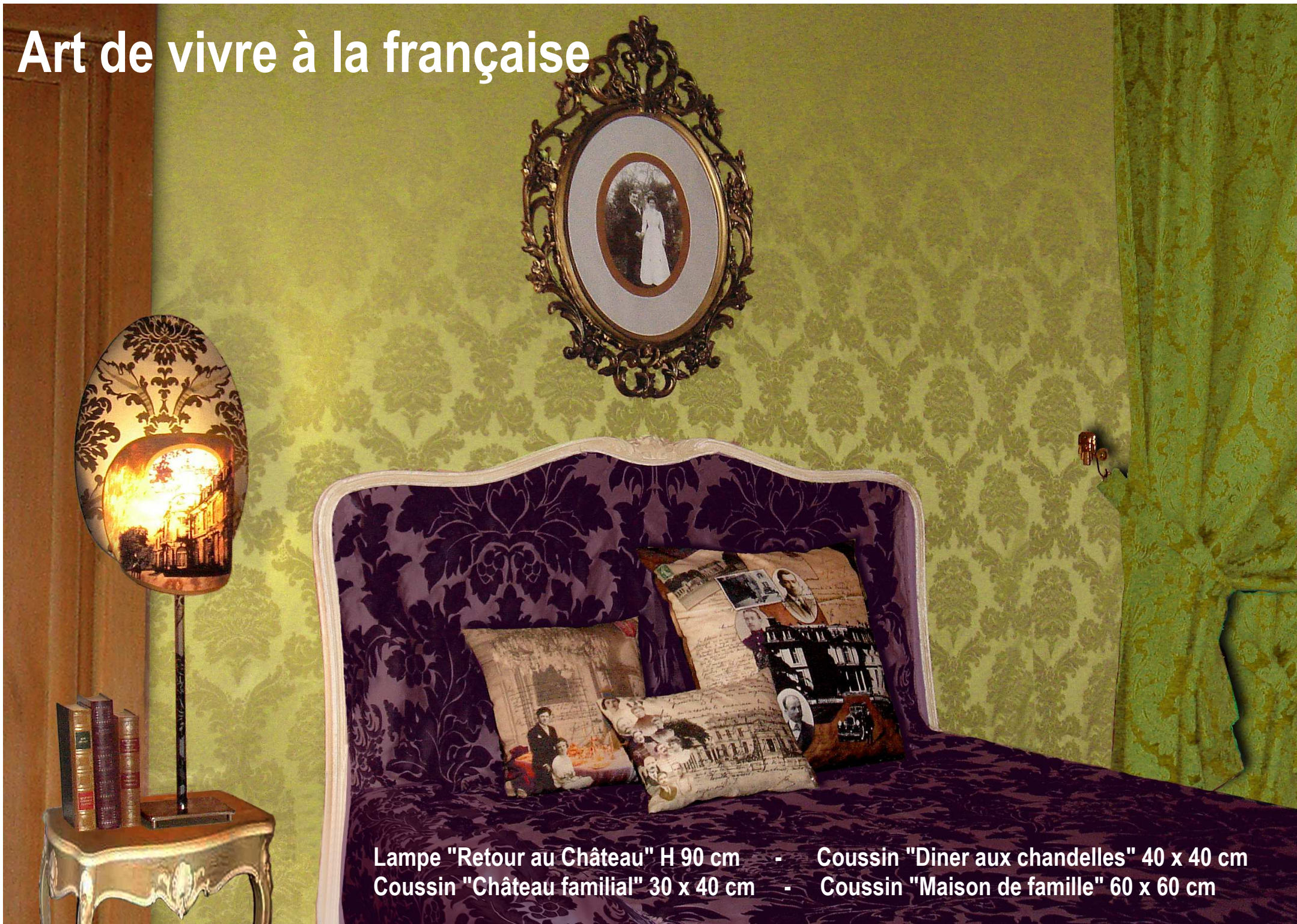
Lampe "Retour au Château" H 90 cm - Coussin "Diner aux chandelles" 40 x 40 cm Coussin "Château familial" 30 x 40 cm - Coussin "Maison de famille" 60 x 60 cm